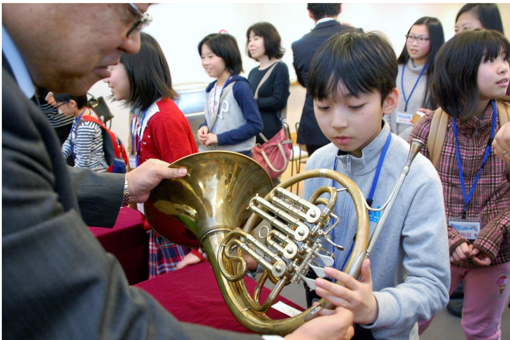
札幌交響楽団の職員からホルンの扱い方を教わる受講生＝中央区の札幌コンサートホール・キタラ