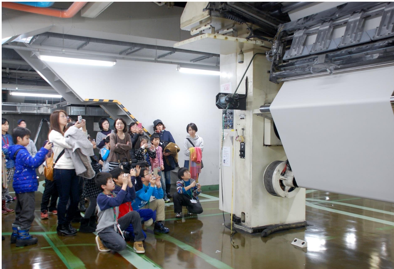
新聞の印刷用紙が交換される様子を見学＝道新総合印刷(北広島市)