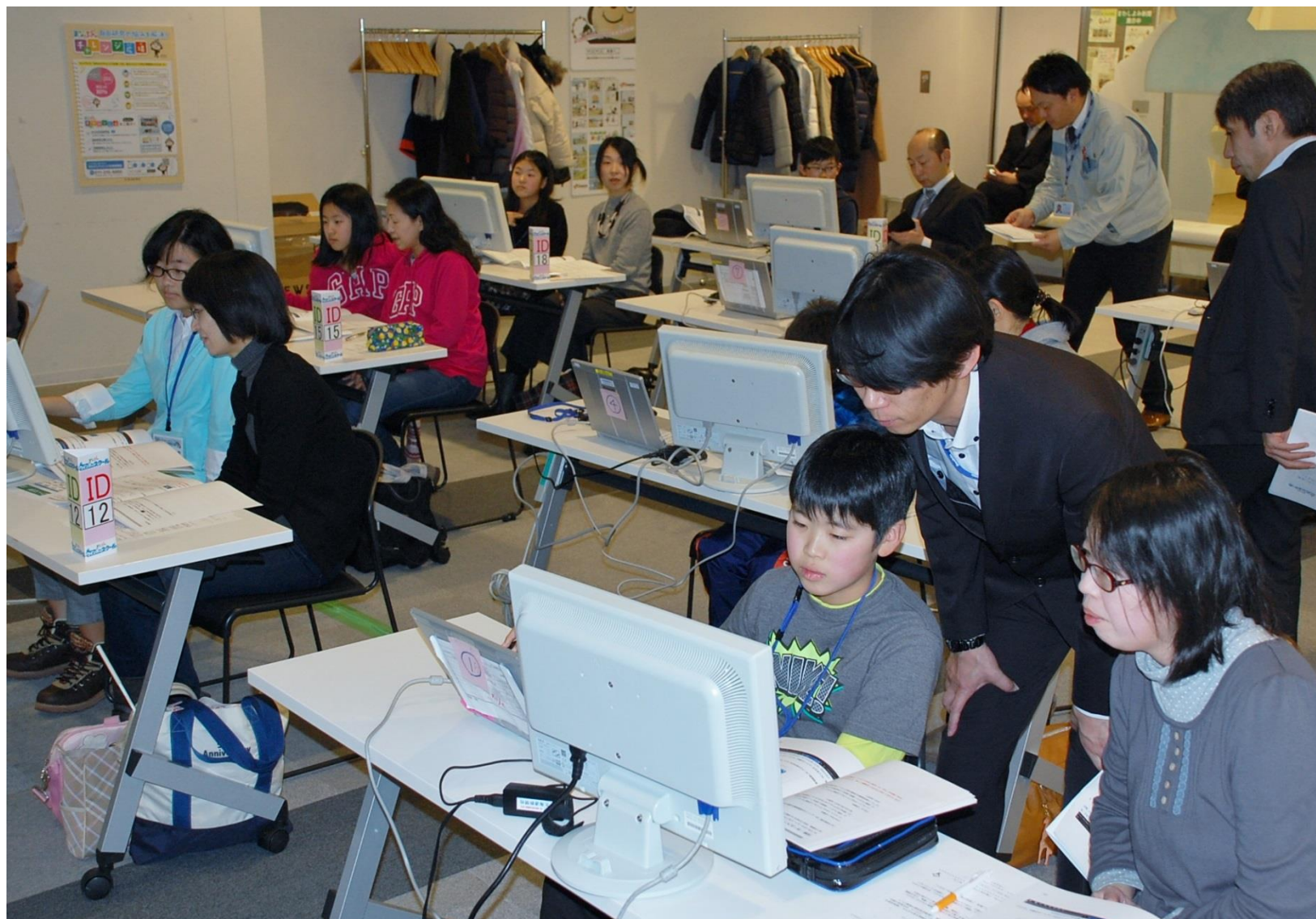
「世界に発信！」を目指してホームページ作りに励むスクール生

小学校の自由研究に役立つ「2017まなぶんウィンタースクール」(北海道新聞社主催) 4日目が1月13日、北海道新聞社(札幌市中央区)で開かれました。雪模様の午前・午後、合わせて17組の親子が参加しました。 この日は道新の技術者が講師の「ホームページを作ってみよう」。オリジナルのページを作りました。 講師の「世界に発信！」の合図でサーバーにデータを送ると、自分の写真や文章が表示され、親子から笑顔と歓声があふれ出しました。