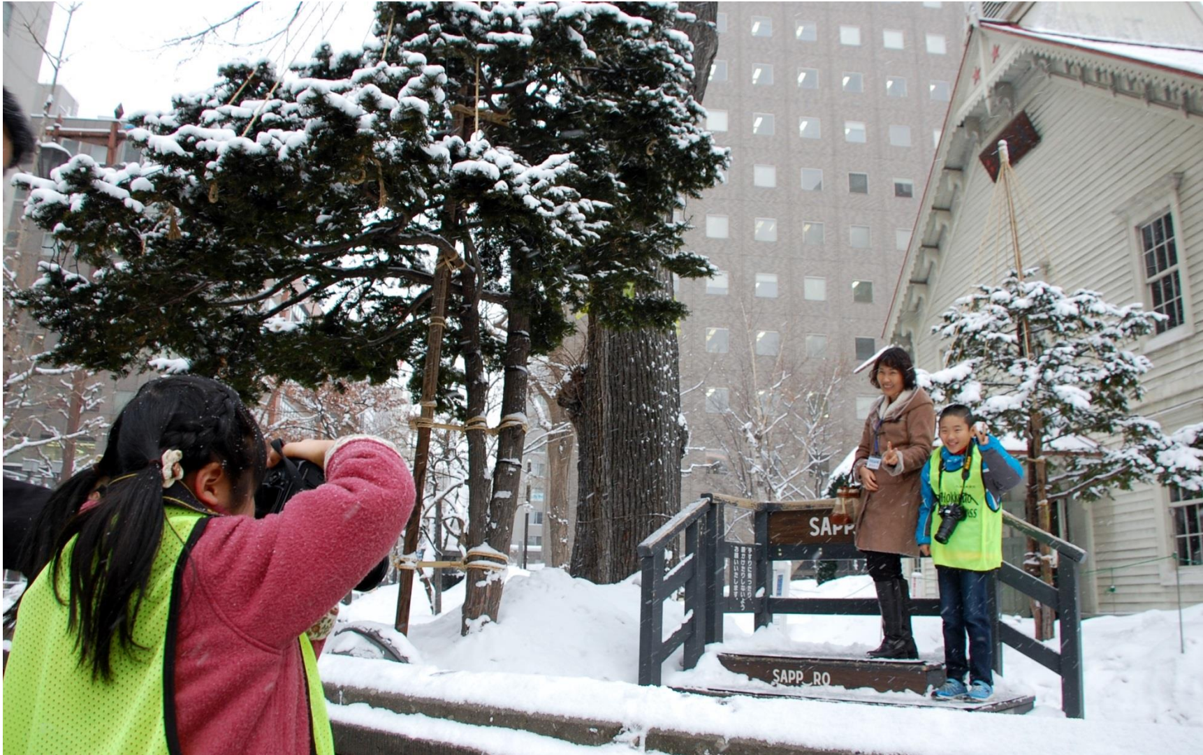
プロ顔負けの構えでファインダーをのぞくスクール参加者