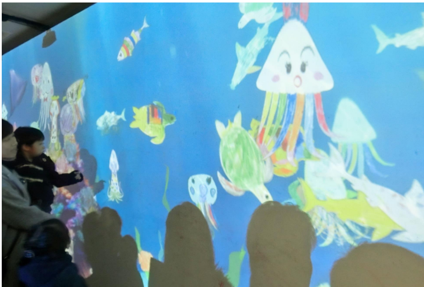
子どもたちが描いた水中の生き物が、踊るようにして泳ぐ不思議な水族館